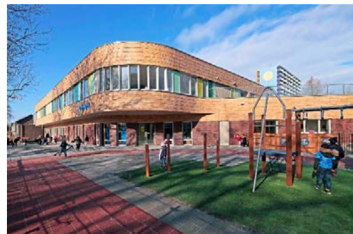
Zaan Primair school