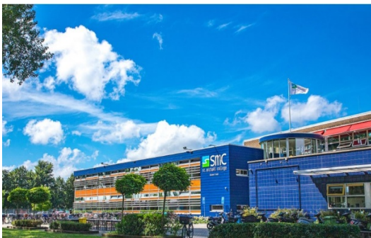
St. Michaël College Zaandam